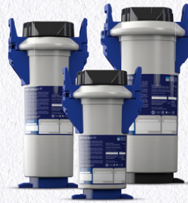
PURITY Quell ST