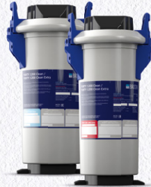
PURITY Clean / PURITY Clean Extra