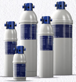
PURITY C Quell ST